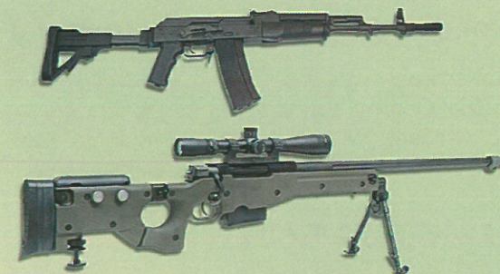
Przykładowa broń na wyposażeniu 3PBOT