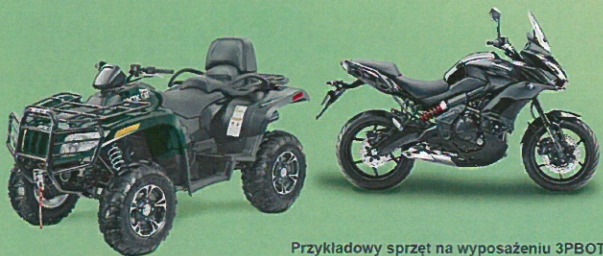
Przykładowy sprzęt na wyposażeniu 3PBOT

Przydać się też może rekomendacja władz pozarządowej organizacji proobronnej, jeśli kandydat do 3 PBOT jest jej członkiem. Albo zaświadczenie, że ukończył szkołę realizującą innowacyjny lub eksperymentalny program przysposobienia obronnego albo edukacji dla bezpieczeństwa. Takie dokumenty mogą się okazać ważne, ustawa bowiem wskazuje, że członkowie takich organizacji oraz absolwenci klas mundurowych mają pierwszeństwo w naborze do 3PBOT. W pierwszej kolejności będą też rozpatrywane wnioski byłych żołnierzy zawodowych oraz osób, które mają pobyt stały lub czasowy powyżej trzech miesięcy na terenie działania danej jednostki 3 PBOT.