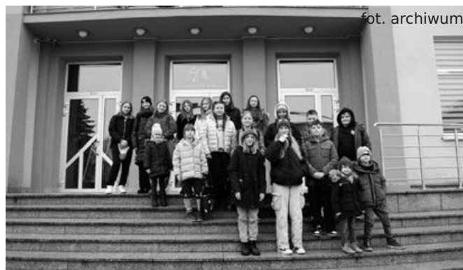
Dydyńska młodzież przed Sanockim Domem Kultury