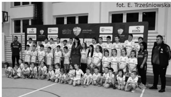
Pamiątkowe zdjęcie w nowych strojach