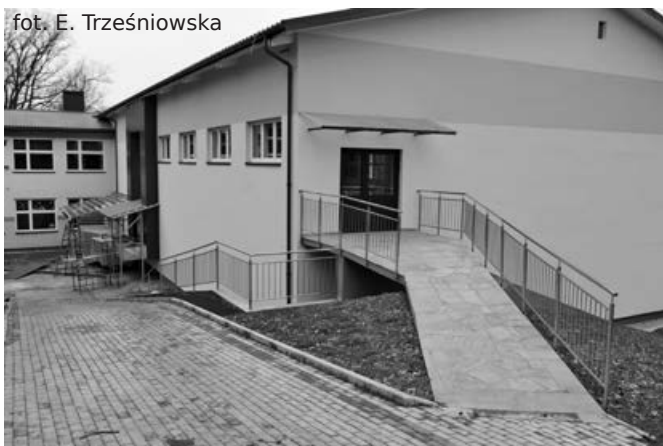
Prace przy Zespole Szkół w Niebocku

Wójt podkreśliła, że jest to niezbędna kontynuacja już rozpoczętych prac przy modernizacji dróg gminnych. - Korzystając ze środków zewnętrznych sukcesywnie przebudujemy drogi, usprawniając tym samym komunikację na terenie gminy. Jest to podstawowe zadanie samorządu, które realnie wpływa na rozwój gospodarczy, nierozzerwalnie związany z dostępem komunikacyjnym. Proszę mieszkańców o cierpliwość - w czasie gdy będą wykonywane prace - czekają nas pewne utrudnienia, jednak wierzę, że końcowy efekt wynagrodzi Państwu wszystkie te niedogodności.