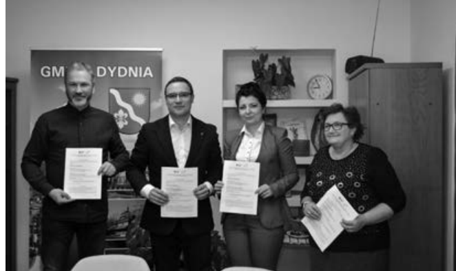
Podpisanie umowy na przebudowę infrastruktury drogowej