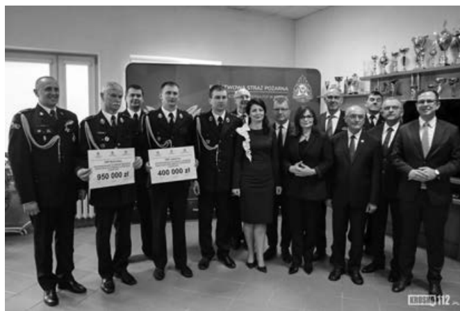
Przekazanie promesy na zakup lekkiego wozu dla OSP Jabłonka