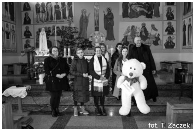
Wręczenie nagrody publiczności

Ogromną satysfakcją dla organizatorów jest fakt, że konkursowe spotkania z kolędą i pastorałką powoli stają się tradycją Niebocka, a poziom artystyczny młodych wykonawców jest z roku na rok coraz wyższy. Spotkania tego typu mają wielkie znaczenie dla dzieci i młodzieży i są wspaniałą okazją, by pokazać światu rozwijające się talenty. Cieszymy się bardzo, że udało się zrealizować podstawowe założenie