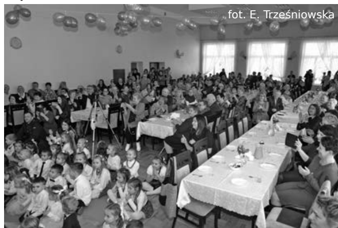
Dzień Babci i Dziadka w Niebocku

Społeczność szkolna w Grabówce świętowała 8 lutego br. Dzieci z pełnym zaangażowaniem przygotowały się do występu artystycznego. Były scenki rodzajowe, w których nie brakowało dobrych rad dla seniorów, popisy taneczne i życzenia śpiewane oraz recytowane. Wszystko zostało przyprawione szczyptą humoru, a o tym, że przybyłym gościom się podobało, świadczyły uśmiechnięte miny babć i dziadków oraz gromkie brawa dla małych artystów.