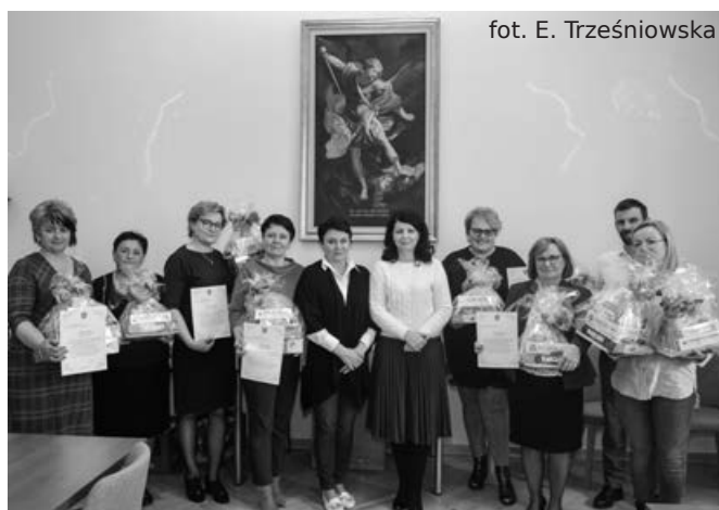
dyrektorki jednostek oświatowych odbierają nagrody za działalność ekologiczną