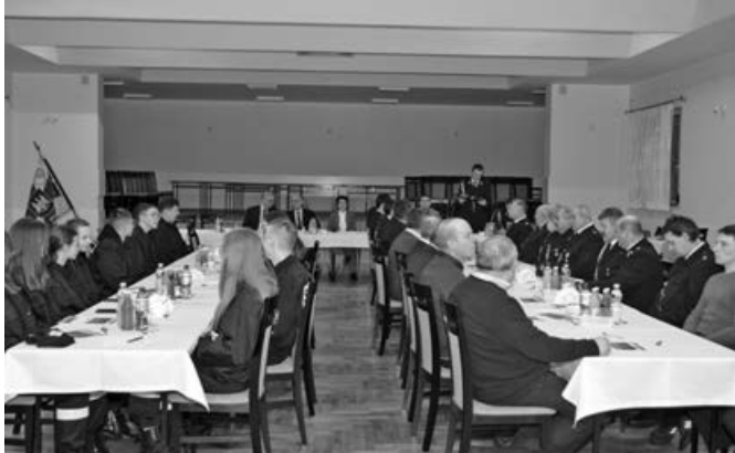
Zebranie strażackie w Jablonce

Zebrania były okazją, by podziękować strażakom za udział w styczniowej akcji usuwania skutków obfitych opadów śniegu na terenie gminy i związanym z tym brakiem prądu, trwającym w niektórych miejscowościach nawet 4 doby. Komendant i przedstawiciele komendy powiatowej wręczyli prezesom OSP listy z podziękowaniami od dyrekcji PGE Dystrybucja Rejon Energetyczny Sanok za udział w akcji.