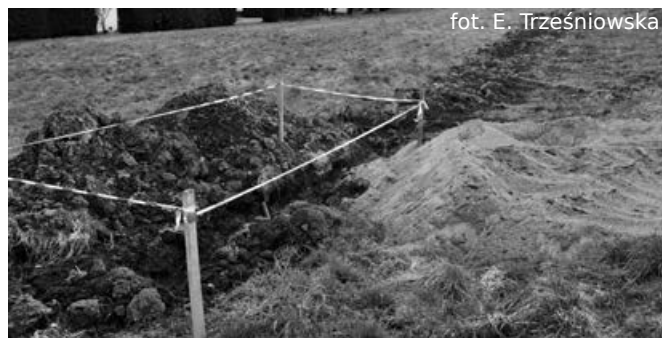
Prace przy budowie kanalizacji sanitarnej

Zakres inwestycji obejmuje modernizację oświetlenia ulicznego polegającego na wymianie istniejących opraw oświetleniowych na oprawy ze źródłem światła LED wraz z modernizacją osprzętu sieciowego, uzupełnienie istniejącego systemu oświetlenia o budowę dodatkowych 5 słupów oraz wdrożenie systemu i narzędzi informatycznych do geolokalizacji, zarządzania i inwentaryzacji oświetlenia ulicznego wraz z aplikacją mobilną i centrum dyspozycyjno-zgłoszeniowym. Inwestycja ma na celu zredukowanie o 70% zużycie energii elektrycznej na potrzeby utrzymania oświetlenia ulicznego oraz obniżenie kosztów bieżących prac konserwacyjnych i napraw.