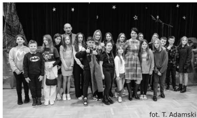
Wspólne zdjęcie wykonawców jasełek