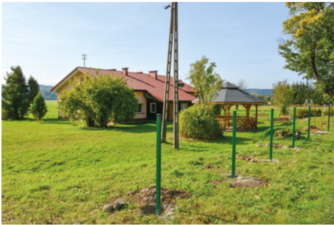
Budowa ogrodzenia przy Domu Ludowym w Ulczu