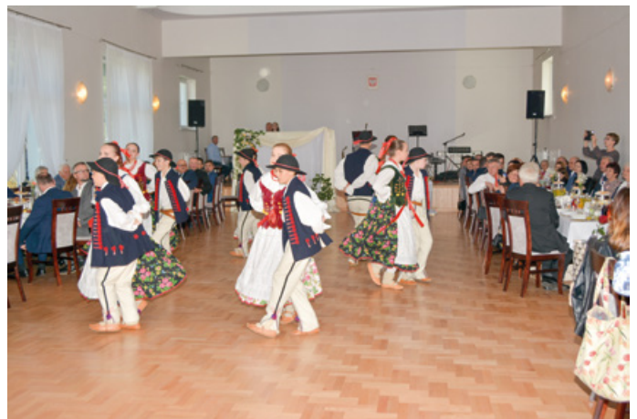
Modernizacja Domu Strażaka w Niebocku