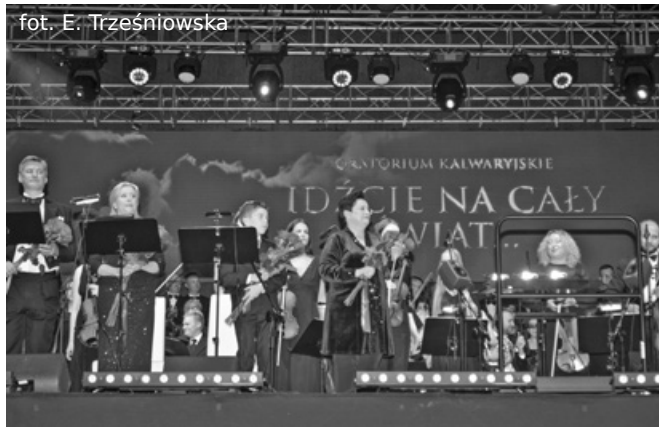
Owacje na stojąco dla orkiestry