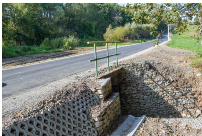
Przebudowa drogi z Witryłowa do Łodziny