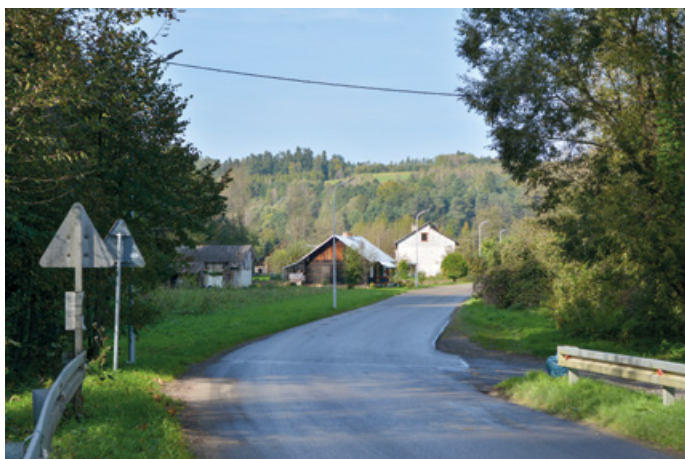
Nowe oświetlenie na trasie Temeszów - Krzemienna