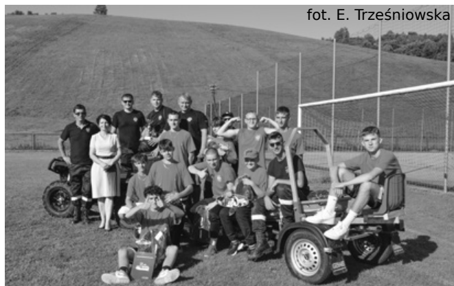
Zwycięzcy zawodów strażackich