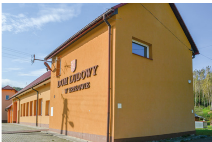
Przebudowa Domu Ludowego w Witryłowie