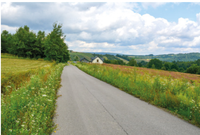
Przebudowa drogi Dydnia - Wola