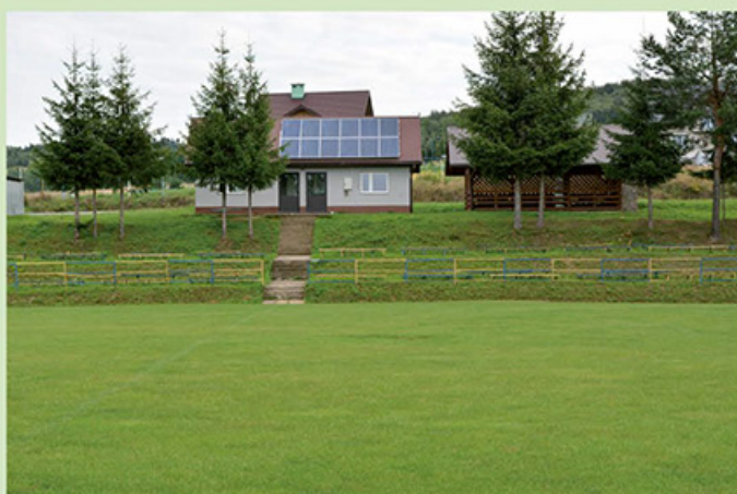
Przebudowa stadionu w Grabówce