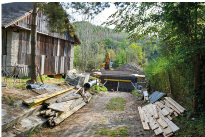
Budowa przepustu na Śwince w Krzemiennej