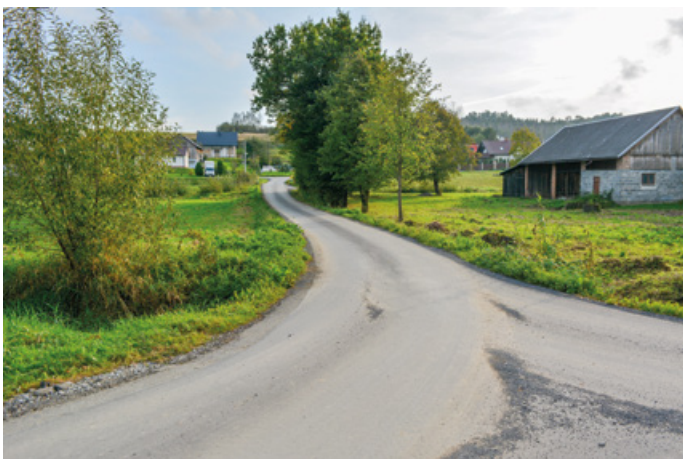
Modernizacja drogi gminnej w Jablonce