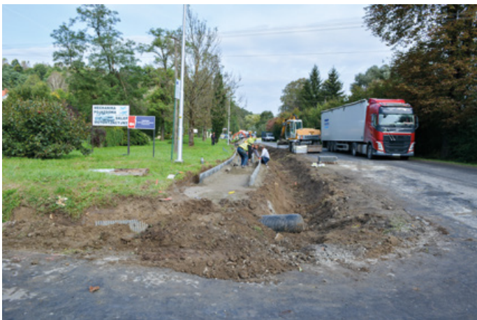
Budowa chodnika w Krzemiennej przy DW