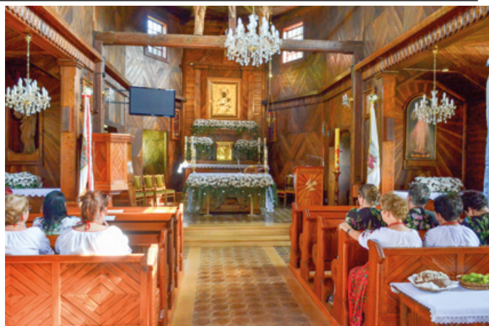
Prace remontowe kościoła w Jablonce