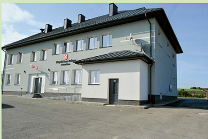
Zagospodarowanie terenu przy WDK w Kóńskim