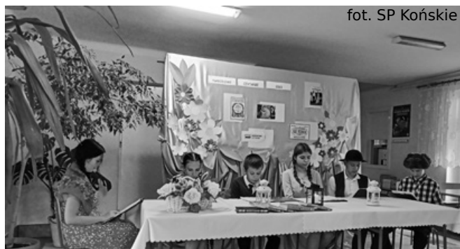
Uczniowie SP w Końskiem pochyleni nad lekturą

15 września przed społecznością szkolną zaprezentowali się starsi uczniowie Szkoły Podstawowej im. Abp. Ignacego Tokarczuka w Końskiem, którzy w specjalnie do-