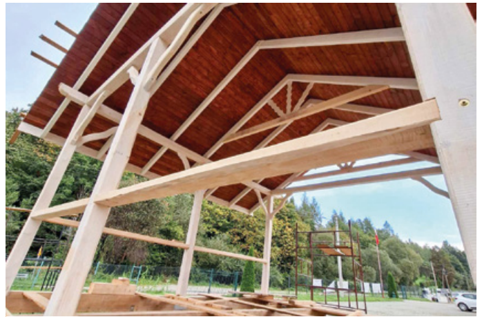
Budowa sceny w Krzywem