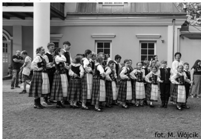
„Kalina” w strojach przeworskich