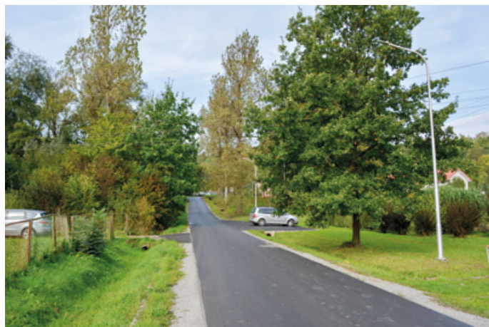
Nowe oświetlenie przy Skwerze Dydyńskich