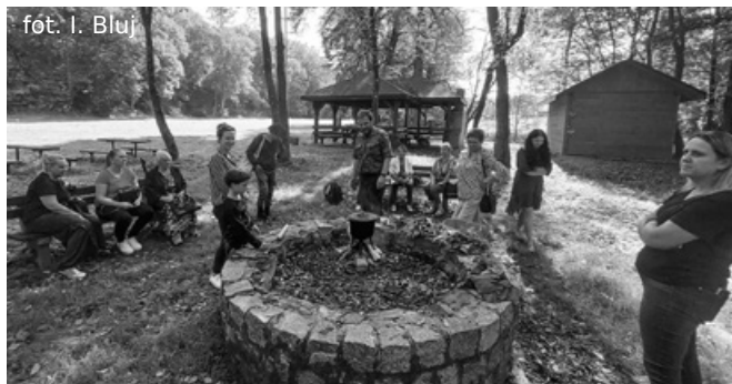
Gotowanie zebranych ziół

Uczestnicy podczas warsztatów wzbogacili się o wiedzę z zakresu zastosowania roślin w ludowym i medycznym ziołolecznictwie. Wzięli udział w części praktycznej, polegającej na poszukiwaniu siedlisk, w których należy szukać dzikich roślin, ich wpływie na organizm ludzki. Przede wszystkim w praktyce dowiedzieli się, jak obrobić zioła, by były przyswajalne do spożycia. Podsumowaniem części wykładowej było wspólne przygotowanie naparu z zebranych ziół. Uczestnicy w tym celu udali się do parku w Dydni, gdzie przekonali się o obecności jadalnych roślin o zdrowotnych właściwościach.