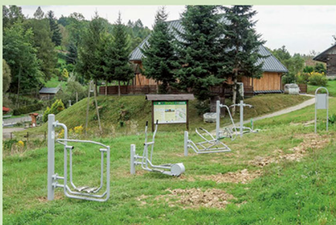
Budowa siłowni zewnętrznej w Krzywem