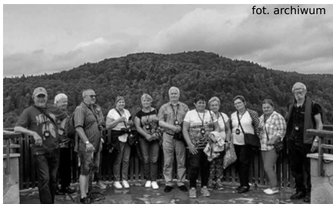
Pamiątkowe zdjęcie seniorów w Muszynie