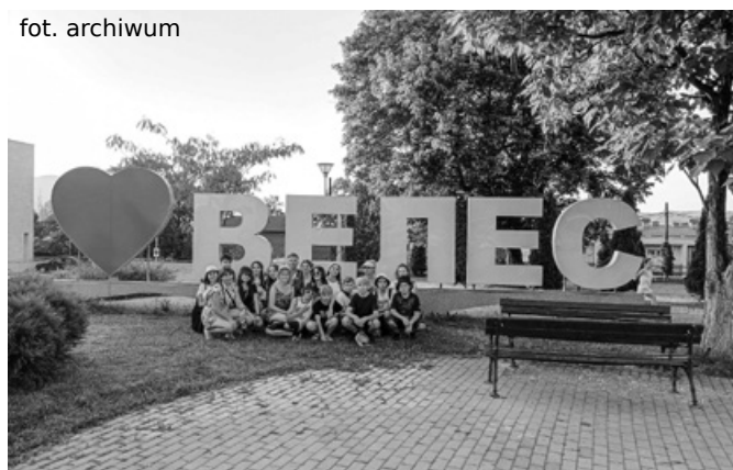
Pamiątkowe zdjęcie „Kaliny” w Veles

Następnego dnia młodzież zwiedzała Veles i poznawała jego historię. Zespół odwiedził ciekawe miejsca, jak choćby pomnik Kosturnica - zwany także miejscem pamięci Ossuary, gdzie oddano hołd macedońskim partyzantom, którzy walczyli podczas Wojny o Wyzwolenie Narodowe w latach 1941–1945 przeciwko faszystowskim siłom niemieckim i bułgarskim. Następnie w starej części miasta młodzi ludzie podziwiali wieżę zegarową oraz tradycyjne domostwo macedońskie, będące jednocześnie muzeum znanego pisarza Kocio Racina. Kolejną atrakcją była wizyta w lokalnym muzeum etnograficznym. Ekspozycja muzeum to prawdziwy wgląd w kulturę i życie codzienne ludności Veles. Młodzież podziwiała rękodzieło, tradycyjne stroje i instrumenty muzyczne, stanowiące część historii tego regionu.