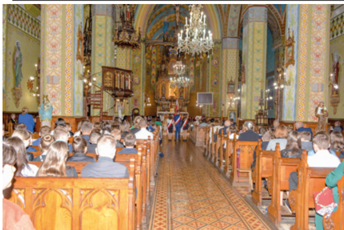
Prace konserwatorsko-restauratorskie ołtarza w kościele w Dydni