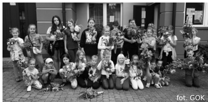
Uczestnicy warsztatów z własnoręcznie wykonanymi bukietami