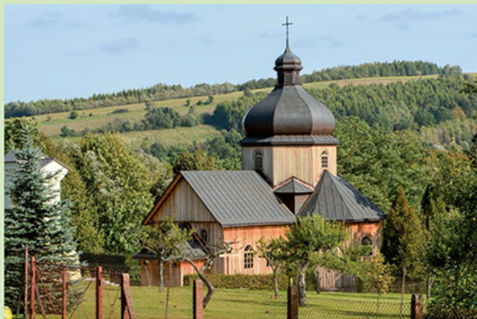
Remont i konserwacja organów w kościele w Kóńskim