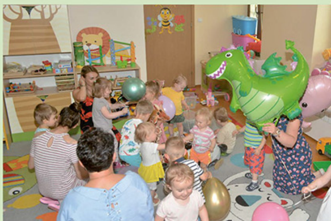
Wykonanie izolacji przeciwwilgociowej w budynku żłobka