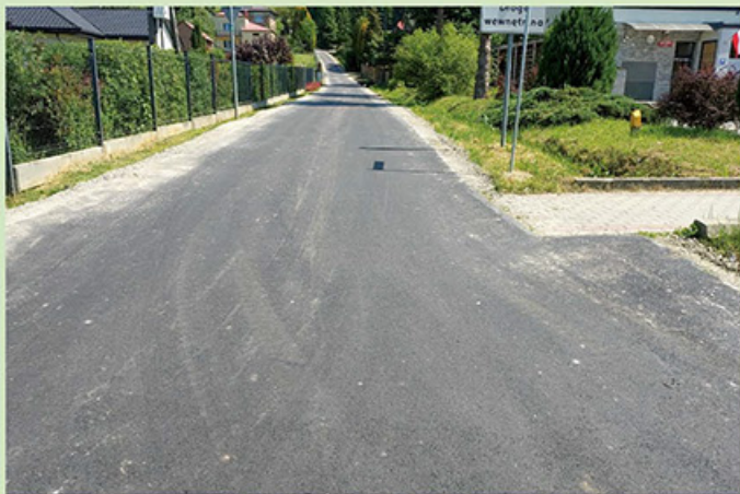
Przebudowa drogi gminnej w Dydni