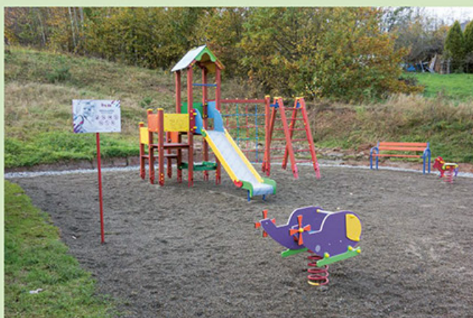
Nowy plac zabaw w Krzywem