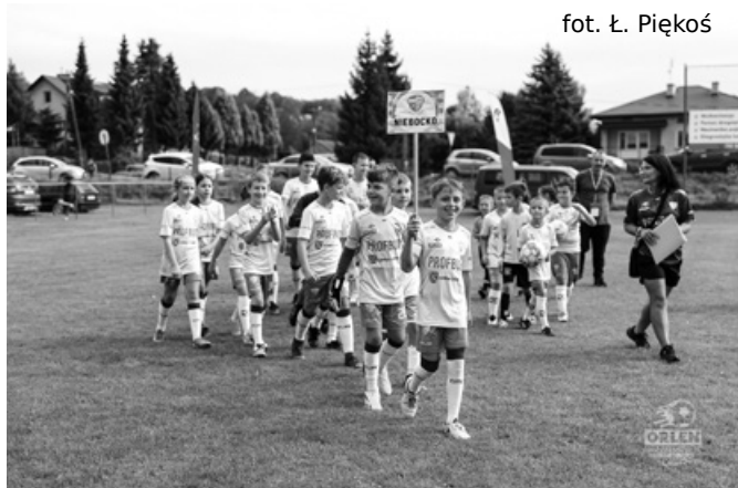
Prezentacja drużyny z Niebocka

oddziałów BSS, a wszystkie zespoły rozegrały mecze w czterech kategoriach wiekowych (2012/2013, 2014/2015, 2016/2017, 2018/2019).