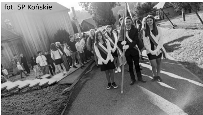
Uroczysty przemarsz do szkoły w Końskim