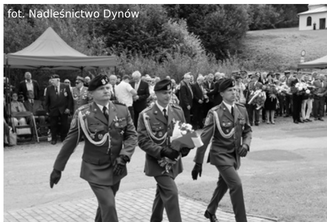
Oddanie hołdu bohaterom

Uroczystości zakończył koncert Orkiestry Dętej z Grodziska Dolnego.