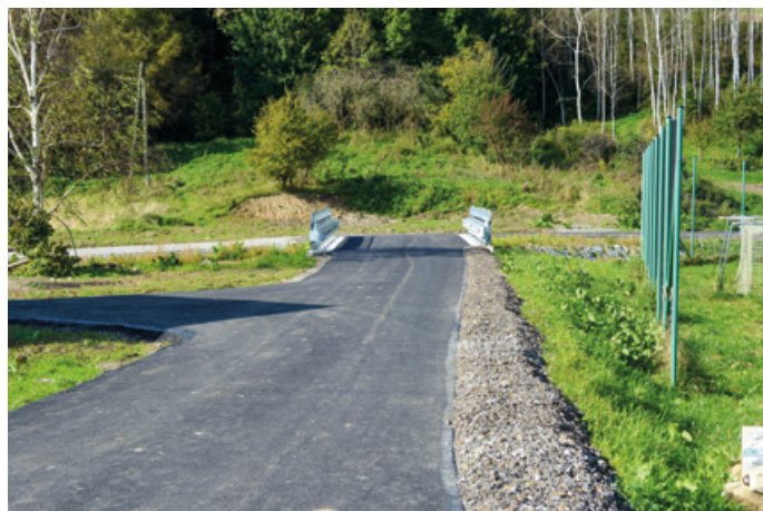
Nowy przepust w Witryłowie