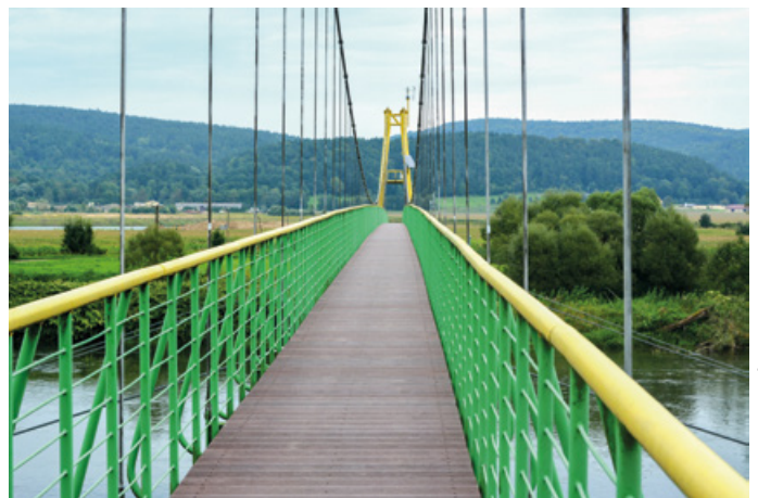
Remont kładki na Sanie