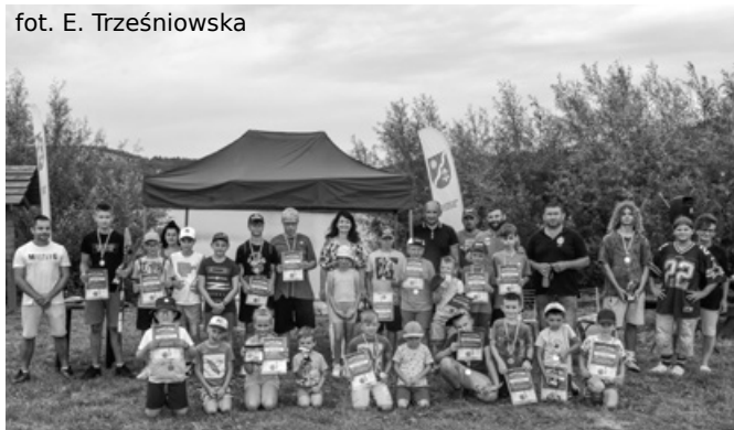
Pamiątkowe zdjęcie uczestników zawodów