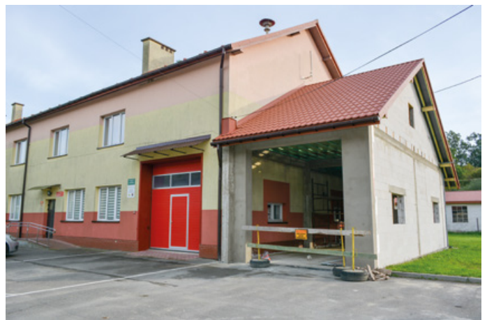
Budowa garażu w Jablonce - I etap