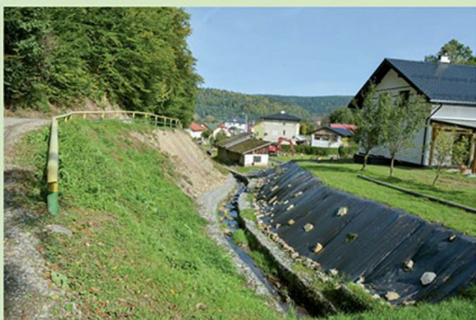
Zabezpieczenie skarpy i budowa kanalizacji w Temeszowie