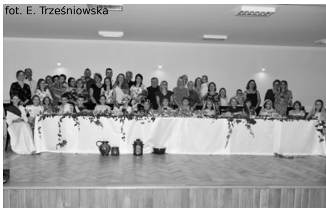
Wspólne zdjęcie uczestników projektu